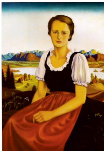
Ilustr. 3. Herbert von Reyl-Hanisch, Mädchenbildnis vor Alpenlandschaft , 1935