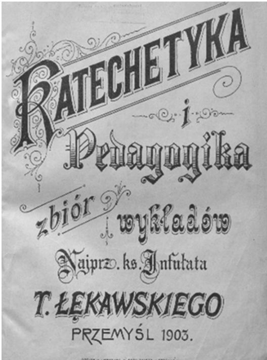
Fotografia 1. Okładka książki ks. Tadeusza Łękawskiego

i mówił: wychowuj: 1) religijnie, 2) naturalnie, 3) prawdziwie i szczerze, 4) harmonijnie, 5) rozsądnie, 6) postępowo i narodowo 51 . Traktując katechetę jako duszpasterza, który ma prowadzić swych wychowanków właściwą drogą, pisał o środkach wychowania. Dzielił je na dwie grupy, tj. środki nadnaturalne i naturalne 52 . Jedne jego zdaniem wpływają na rozum, inne zaś na wolę, nadając jej kierunek rozwoju. Do grupy tych pierwszych zaliczył: modlitwę, udział we mszy świętej i uroczystościach kościelnych oraz przyjmowanie sakramentów. Zalecał, aby dużą wagę przykładac do modlitwy i pieśni kościelnych. Stwierdzał, że w stosowaniu wszystkich tych środków katechetom przypada rola pierwszoplanowa, chociaż, jeśli chodzi o modlitwę, katecheci wspierani mogą być przez rodzinę.