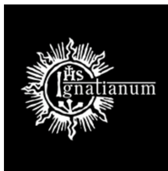
Rys. 5 Logo białe