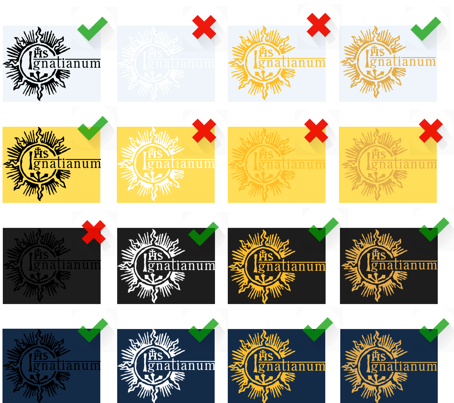
Rys. 13 Kolorystyka tła logo - przykłady

Zasadą, którą należy stosować bezwzględnie podczas umieszczania logo na różnych kolorach tła jest jego dobra widoczność i czytelność. Poniżej zaprezentowane zostały dozwolone kolory logo użyte na różnych, przykładowych kolorach tłach.