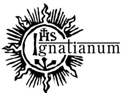
Rys. 1 Podstawowa wersja logo

Podstawowa wersja logo to główny element identyfikacji wizualnej uczelni. Logo wykorzystuje symbol zakonu Towarzystwa Jezusowego, wpisując w niego nazwę uczelni.