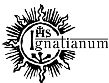
Rys. 4 Logo czarne