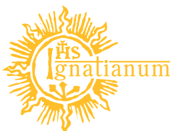
Rys. 6 Logo złote