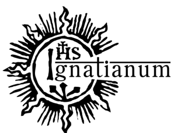
Rys. 14 Podstawowa wersja logo w języku angielskim