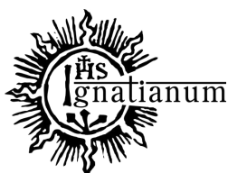
Rys. 15 Alternatywna wersja logo w języku angielskim